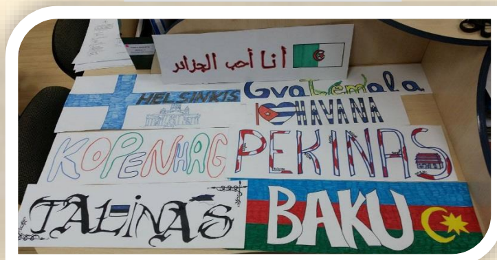
Turizmo dienos plakatai

Sekančią, Rugsėjo 28 dieną, visi fakulteto studentai bei dėstytojai buvo pakviesti nusifotografuoti bendrai nuotraukai prie išradingai parengto gaublio.