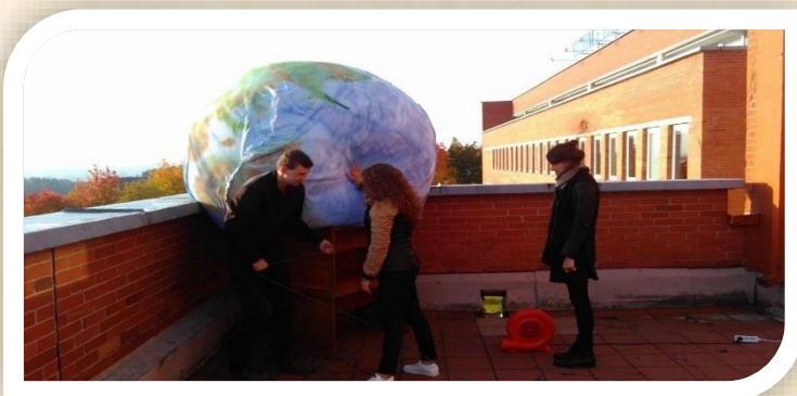
Imitacinio gaublio kūrimas

Pasiruošimo darbai Turizmo dienos minėjimui vyko intensyviai. Pagrindiniai rėmėjai buvo extremelight.lt ir dronai24.lt. Extremelight.lt pagalba gavome pripučiamą burbulą, kurį pavertėme Pasaulio gaublio imitacija. Dronai.lt atsovas įamžino mus visus.