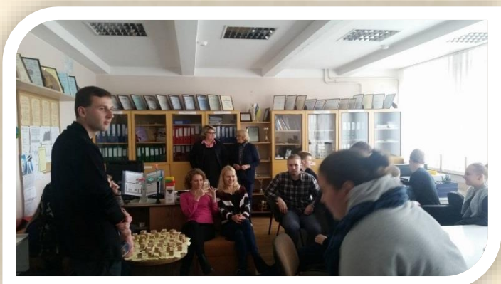
IB „Vilionė“ ir IB „Miglė“ pasisėdėjimas

Praėjus šventei IB „Vilionė“ kartu su IB „Miglė“ susirinko kartu pasidžiaugti savo darbo vaisiais ir prie puodelio arbatos ir gabalėlio torto linksmai pasisėdėjo.